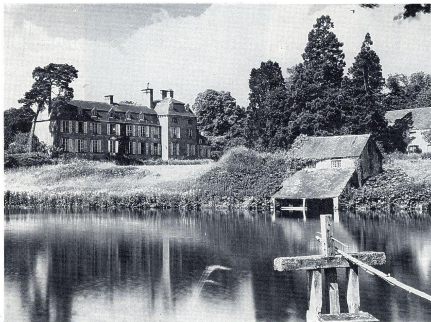
Le château du Grais.