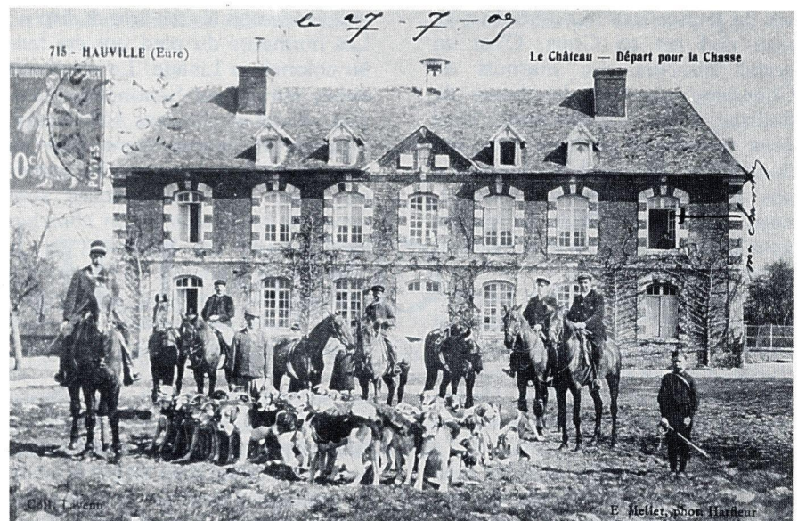
La Vautrait d'Houville en déplacement en forêt de Brotonne (Seine-Maritime).

Le surlendemain, je partais pour Paris et rentrais au collège. Inutile de dire que mon cahier de devoirs de vacances était vierge !